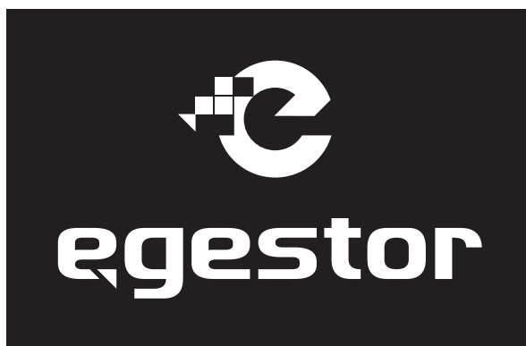
Versão em negativo